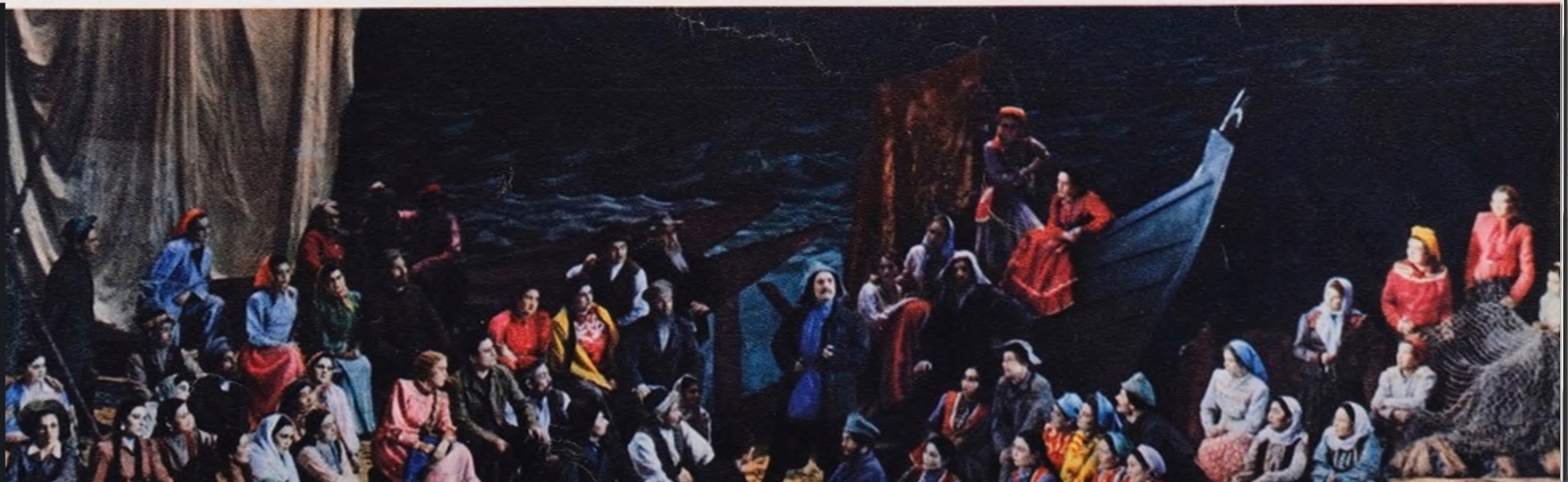
Сцена из первого акта оперы Е. Брусиловского «Дударай», посвященной дружбе казахского и русского народов.