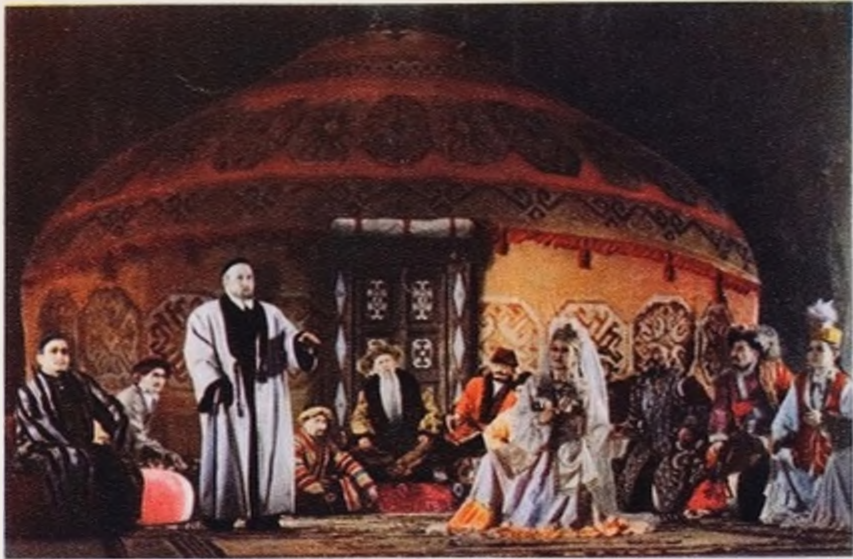
Сцена из оперы А. Жубанова и Л. Хамиди «Абай», посвященной великому поэту и просветителю казахского народа Абаю Кунанбаеву (1845—1904 годы).